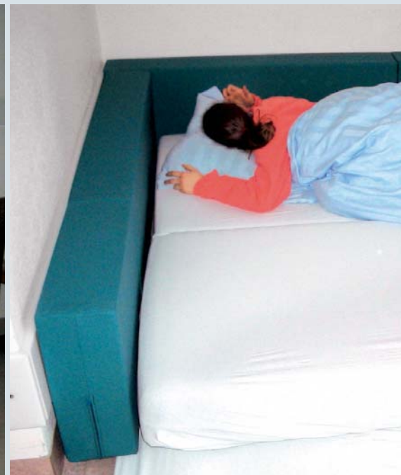
Zwei Matratzen nebeneinander bieten unruhigen PatientInnen ausreichend sicheren Raum.