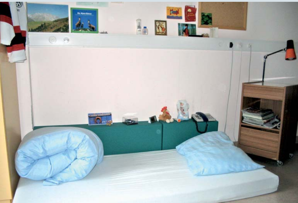
Umgebungsgestaltung: Nische mit persönlichen Gegenständen vermittelt Geborgenheit.