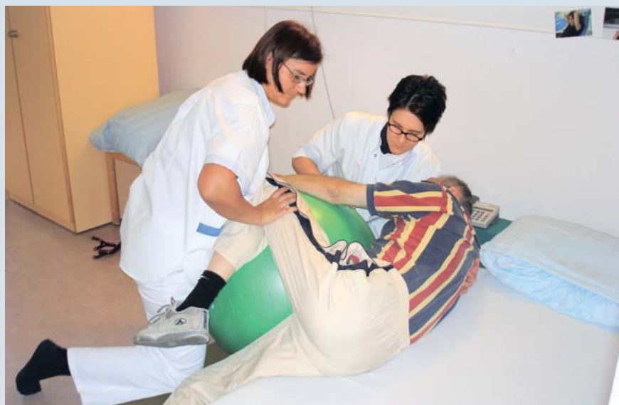
Unter fachkundiger Anleitung seitlich von der Matratze rollen.

Ein Kursbesuch alleine reicht nicht aus.