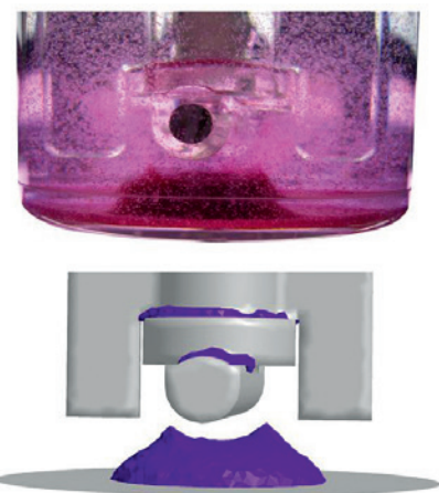
Abb. 1: Vergleich der experimentellen (oben) und simulierten (unten) Microcarrierverteilung