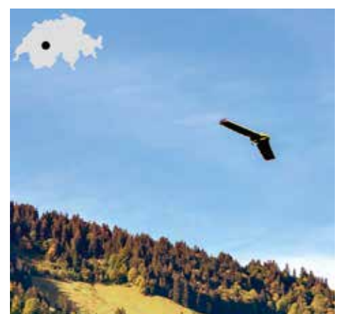
Abb. 1: Drohnenbefliegung einer Auenlandschaft im Berner Oberland am 17.09.2014