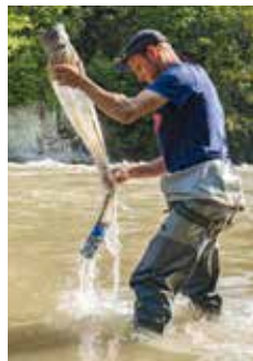
Untersuchungen an der Sarsine

Der Schwallbetrieb von Speicherkraftwerken führt zu Abfluss- und Pegelschwankungen. Diese können sowohl kurz- wie auch langfristige Auswirkungen auf die aquatischen Lebensgemeinschaften haben. Bei einem raschen Anstieg des Abflusses nehmen Scherkräfte, Fliessgeschwindigkeit und Wassertiefe des entsprechenden Gewässers zu, was zur Bewegung von Teilen der Gewässersohle führen kann. Aufgrund der damit verbundenen hydraulischen Kräfte müssen aquatische Wirbellose, die den Gewässergrund besiedeln (Makrozoobenthos), viel Energie aufwenden, um eine stromabwärts gerichtete Verlagerung zu vermeiden. Die hydraulische Belastung kann somit einen erheblichen Einfluss auf die Verdriftung und Ausschwemmung dieser Lebewesen haben. Das Projekt untersucht die Zusammenhänge zwischen dem Schwallbetrieb und der Reaktion des Makrozoobenthos. Ziel ist es, Prognosen für die Wirkung von Sanierungsmassnahmen erstellen zu können. Damit ist das Projekt von grosser Bedeutung für die Umsetzung von Schwall-Sunk-Sanierungen in der Schweiz und im Alpenraum. ■