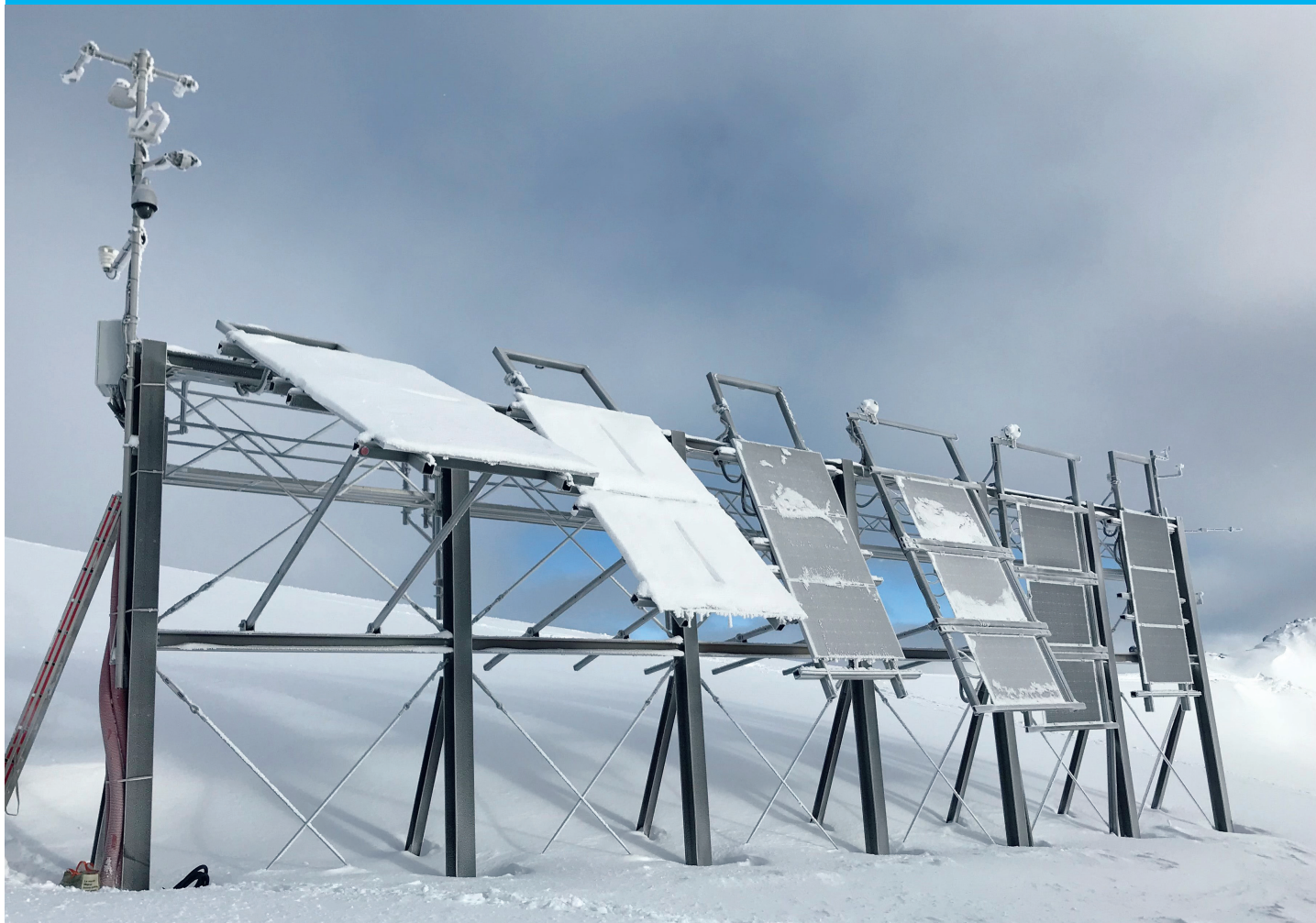
Alpine Versuchsanlage in Davos-Talalp auf 2500 m.ü.M.