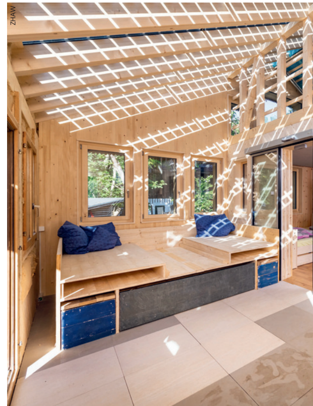
Der Wärmeeintrag des Wintergartens trägt zur Klimatisierung des Kerns bei.

Es wurde kein Beton verbaut; das Gebäude ist eine Holzkonstruktion, die auf Stahl-Schraubfundamenten steht. So lässt es sich am Ende seiner Lebensdauer auch wieder leicht zerlegen. Auf einen Wasseranschluss konnte verzichtet werden; das KREIS-Haus verfügt über grosse Tanks, einer für das Regenwasser, das nach dem Passieren einer Filterkombination Trinkqualität hat, ein zweiter für das Grauwasser von der Küche und der Dusche, das im «Dachgarten» zum Einsatz kommt. Das WC ist eine Trockentoilette: Urin landet in einem Tank unter dem Haus, ein benachbartes Urin-Verdunstungsmodul verwandelt ihn in Düngergranulat. Die Feststoffe werden mittels Betätigung eines Fusspedals auf einem