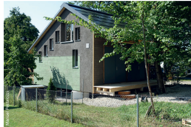
Die nach Norden orientierte «Technikfassade» wird über eine Terrasse erschlossen.