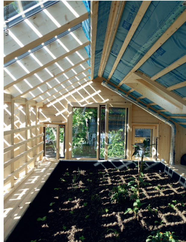
Die Galerie unter dem Dach beherbergt ein Treibhausbeet. Die Pflanzen werden mit Brauchwasser gegossen.