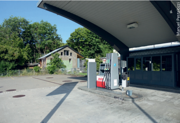
Das KREIS-Haus steht am Rand des Synergy Village, gleich neben einem auffälligen Tankstellenpaar.

KREIS steht bei diesem bewohnbaren Experimentalbau für Klima- und Ressourcen-Effizienz und Synergie. Im Synergy Village in Feldbach (ZH) macht er ein interessantes typologisches Statement.