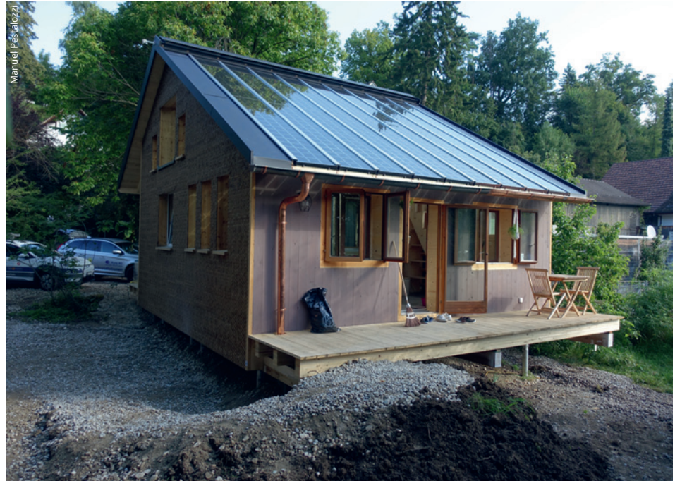
Der Zugang erfolgt über eine Rampe und die Terrasse vor der Südfassade. Die Westfassade ist mit Schindeln verkleidet.

Der kompakte, mit einem Satteldach gedeckte zweigeschossige Neubau hat eine Fläche von rund 40 Quadratmetern. Er besetzt ein Terrain in der Südostecke des Synergy Village – gleich neben einem prägnanten Avia-Tankstellenpaar, dessen auskragende Vordächer wie die Greifer einer Zange die stark frequentierte Seestrasse flankieren. Das KREIS-Haus ist eigentlich das vollkommene Gegenteil dieser konventionellen Versorgungsstation und füllt städtebaulich sinnvoll eine bisherige Leerstelle auf dem Areal. Als Modellhaus hat es von der Gemeinde eine temporäre Ausnahmebewilligung für fünf Jahre erhalten und ist ein angewandtes Forschungsprojekt der