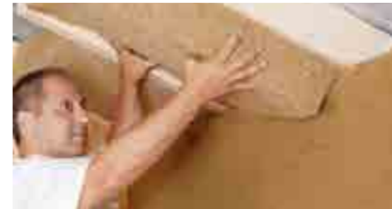
Der Einbau von Dämmmatten aus Hanf in einem Dach.

Hanf ist ein hochwertiger Naturdämmstoff mit sehr guten Eigenschaften. Er gilt als feuchteregulierend, bietet einen guten Hitze- sowie Schallschutz, ist schimmelpilzresistent und auch baubiologisch empfehlenswert. Hanf-Baustoffe sind CO 2 -Senken: