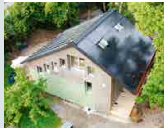
Das Kreis-Haus in Feldbach/ZH, ein Forschungsprojekt der ZHAW, ist mit Hanf gedämmt. (Bild: Devi Bühler)