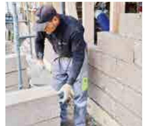
Einbau von Hanfsteinen als Aussenwanddämmung.

Dieter Baltensperger, stroba naturbaustoffe ag