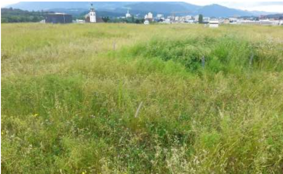
Abb. 7. Dach C im Juni 2015. Die Vegetation erreicht auf grossen Teilen der Dachfläche eine Höhe von 30–50 cm. Dies bietet bereits geschlüpften Küken gute Versteckmöglichkeiten. Da Kiebitze zum Brüten aber übersichtliche Verhältnisse bevorzugen, nutzen sie das Dach C wegen der hohen Vegetation im späteren Frühjahr nicht für Ersatzgelege.

Dach B: Die Staunässe und der Schattenwurf des nebenstehenden Gebäudes A bewirken auf Dach B, dass sich fast flächendeckend Moose etablieren konnten. Auch auf diesem Dach wurden in die Hügelformationen einige Jungpflanzen eingepflanzt. Die Vegetation während der Brutzeit besteht neben dem Moosbewuchs hauptsächlich aus niedrigwachsenden Gräsern und Kräutern. Die meisten siedelten sich spontan an.