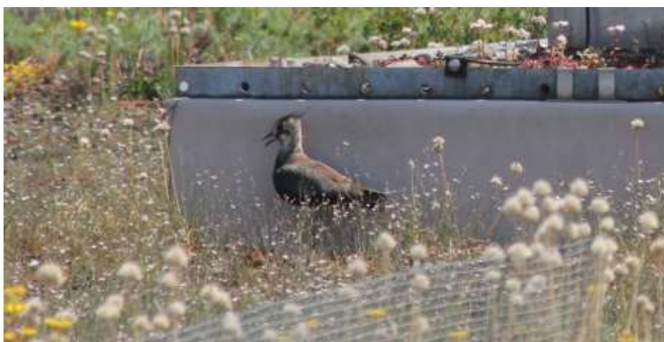
Abb. 10. Hecheln in der Hitze: Dieser Jungkiebitz nutzt eine Lukarne auf Dach A als Sonnenschutz. Sein Gefieder ist schon so weit entwickelt, dass eine Thermoregulation möglich ist.