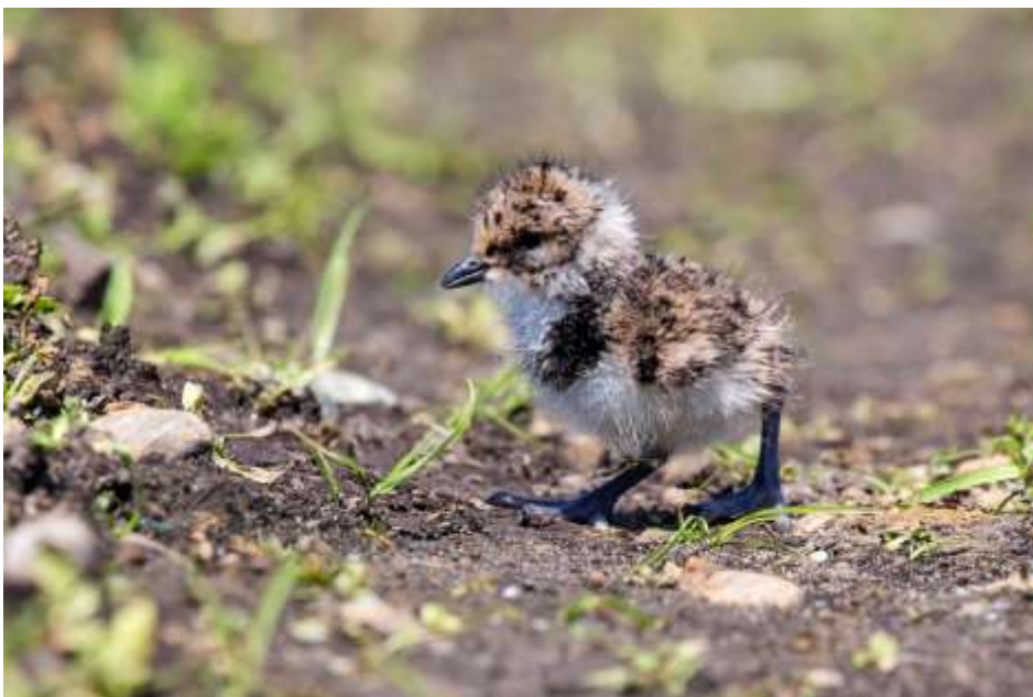
Abb. 3. Das Kiebitzküken ist schon kurz nach dem Schlüpfen aktiv und sucht selber nach Nahrung. In den ersten Tagen braucht es zum Überleben aber die Führung, die Betreuung und den Schutz der Eltern.

Kiebitzküken werden von den Eltern nicht gefüttert. Sie gehen schon unmittelbar nach dem Schlüpfen – angeleitet und betreut von den Eltern – selber auf Nahrungssuche. Die mit Daunen befiederten Küken können ihre Körpertemperatur noch nicht aufrechterhalten und brauchen die Körperwärme der Eltern (huden). Während ihrer ersten Lebensstage sind sie noch tollpatschig. Darum gehören während dieser Zeit wenig mobile, sich langsam bewegende Wirbellose auf der Bodenoberfläche zu ihrer Hauptnahrung. Dazu zählen vor allem Insekten und deren Larven, Tausendfüssler, Ameisen, Springschwänze, Milben und Schnecken. Kiebitzküken nutzen also ein relativ breites Nahrungsspektrum.