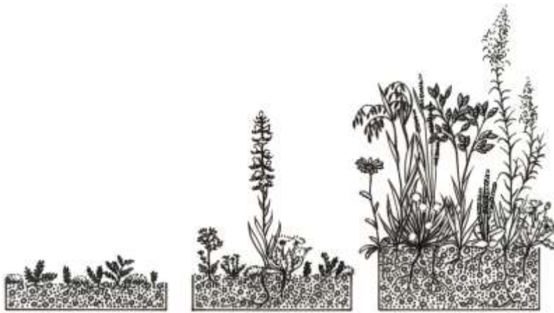
Abb. 13. Schematische Darstellung von verschiedenen hohen Substratschichtdicken (links ca. 7–8 cm, Mitte ca. 10 cm, rechts ca. 12–15 cm) und der sich darauf entwickelnden pflanzlichen Biomasse. Eine Flachdachfläche mit mehreren Bereichen von unterschiedlicher Substrathöhe ergibt die vielfältigsten Ausprägungen.

Vegetationsbereiche bieten Deckung vor Feinden und Schatten an heissen Tagen. Ein erhöhter Anteil an Biomasse im Substrat (abgestorbene Pflanzen oder Komposterde) verbessert die Nahrungsressource für Jungvögel.