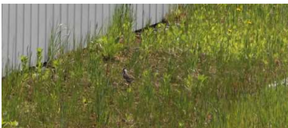
Abb. 11. Kiebitzküken, welches auf Dach B eine Fläche im Schattenwurf von Dach A erreicht.