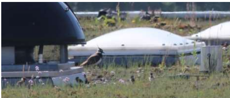
Abb. 9. Frisch geschlüpfte Kiebitze sind noch nicht zur Thermoregulation fähig. Bei kalter und nasser Witterung finden sie unter den Flügeln der Altvögel Schutz. Bei heissem Wetter verstecken sie sich am Boden in höherer Vegetation. Das Foto zeigt sie auf Dach A auf dem Weg in den Schatten eines Dachaufsatzes.