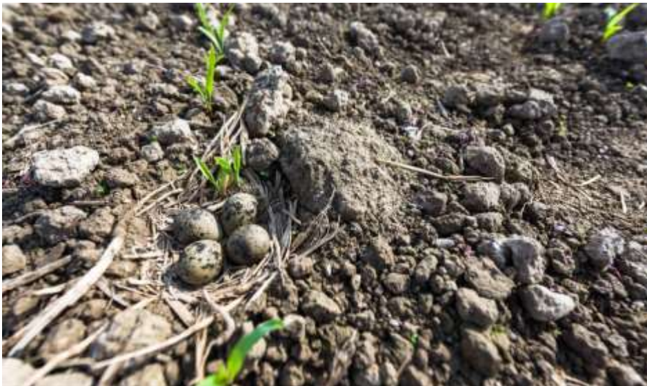
Abb. 2. Kiebitzgelege auf einem neu angesäten Maisfeld in der Wauwiler Ebene. Die Eier werden in eine Mulde gelegt, die etwas mit Vegetation ausgepolstert wird. Kiebitze bauen aber kein kunstvolles Nest – es soll sich möglichst nicht von der Umgebung unterscheiden.

Kiebitze legen meist 4 Eier. Es dauert ca. 33 Tage, bis die Küken schlüpfen. Nach weiteren ca. 35 Tagen sind die Küken flugfähig (= flügge). Damit die Population nicht abnimmt, also die Sterblichkeit der Altvögel durch Nachwuchs ausgeglichen wird, müssten 0,8 Küken pro Brutpaar und Jahr flügge werden.