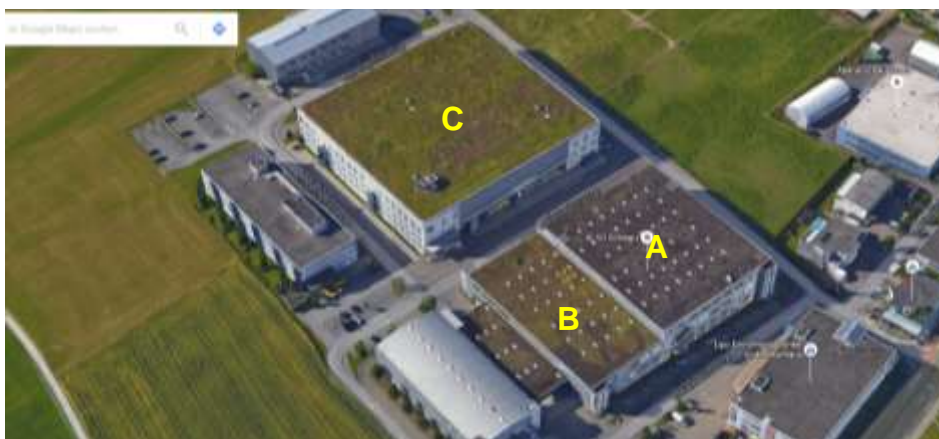
Abb. 5. Das Die drei von den Kiebitzen genutzten extensive begrünten Flachdächer der Firma ALSO Schweiz AG in Emmen aus der Vogelschauerspektive. Deutlich zu erkennen ist die geringere Vegetationsbedeckung auf dem Dach A, das sich kaum vom südöstlich davon gelegenen Kiesdach ohne Vegetation unterscheidet. Andererseits unterscheidet sich die Begrünung auf dem Dach C kaum vom landwirtschaftlich genutzten Umland.

diesem Dach zeigten vergleichbare Abundanzen von erfassten Spinnen (> 5 mm Körpergrösse) wie auf Bodenstandorten und etwa drei Mal höhere Werte als auf dünn-schichtigen Dachbegrünungen mit voller Sonnenexposition (Brenneisen et al 2010). Die Abundanz von Käfern (> 5 mm Körpergrösse) ergab keine Unterschiede, jedoch die weiteren erfassten Bodentiere (Ameisen etc.) waren auf dem feuchteren Dach B in Emmen doppelt so häufig wie auf der dünn-schichtigen Vergleichs-Dachbegrünung. Man kann zudem davon ausgehen, dass die dichtere Vegetation mit einer höheren Anzahl an Blüten mehr Fluginsekten anzieht. Halten sich diese in Bodennähe auf, dürften sie für etwas ältere Kiebitzküken auch zum Nahrungsangebot zählen.