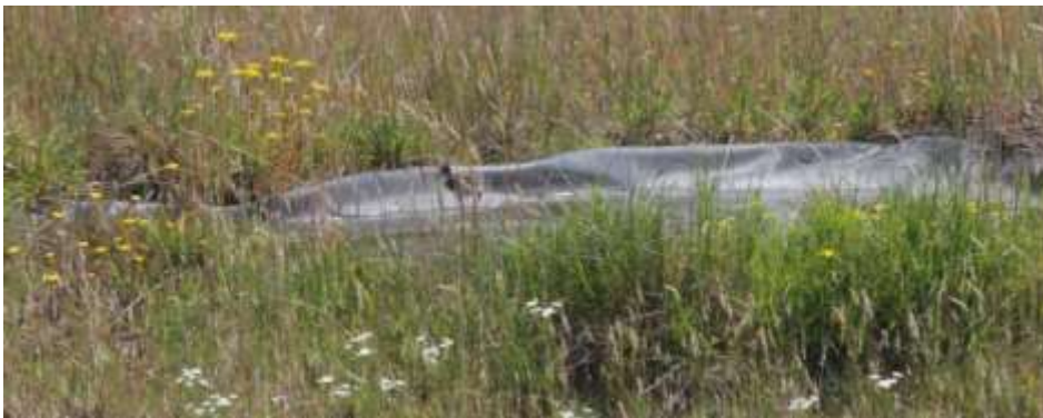
Abb. 8. Ein Kiebitzküken kühlt sich die Beine im Teich auf Dach B.

Auf den Dächern A und B wurde mit Teichfolie je ein kleiner Teich eingerichtet. Vor allem für die späteren Gelege sind sie in heissen Tagen wichtig. Die Kiebitze nutzen sie intensiv zur Abkühlung, zum Trinken und als Bereiche mit sicherem Nahrungsangebot (Abb. 8). Die um den Teich herum etwas höher wachsende Vegetation bietet auch etwas Schatten und Deckung. Dach C verfügt über keinen Teich.