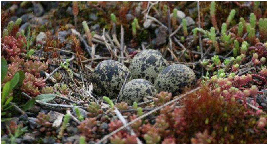
Abb. 12. Gelege auf Dach C. Kiebitze legen meist vier Eier in eine nur schlecht entdeckbare Mulde in die lückige Vegetation. Die Eier sind konisch geformt und rollen somit nicht aus der Mulde heraus. Ihre hell-erdfarbene, dunkel gesprenkelte Schale lässt die Eier optisch in der Umgebung verschwinden.

Seit 2010 werden durch die Orniplan AG im Auftrag des SVS/BirdLife Schweiz und im Rahmen des Programms Artenförderung Vögel Schweiz 1 die Zahlen zu Bestand und Bruterfolg in der Schweiz systematisch erhoben. Für die Dachbruten in Emmen die Brutdaten pro Jahr seit 2008 vor.