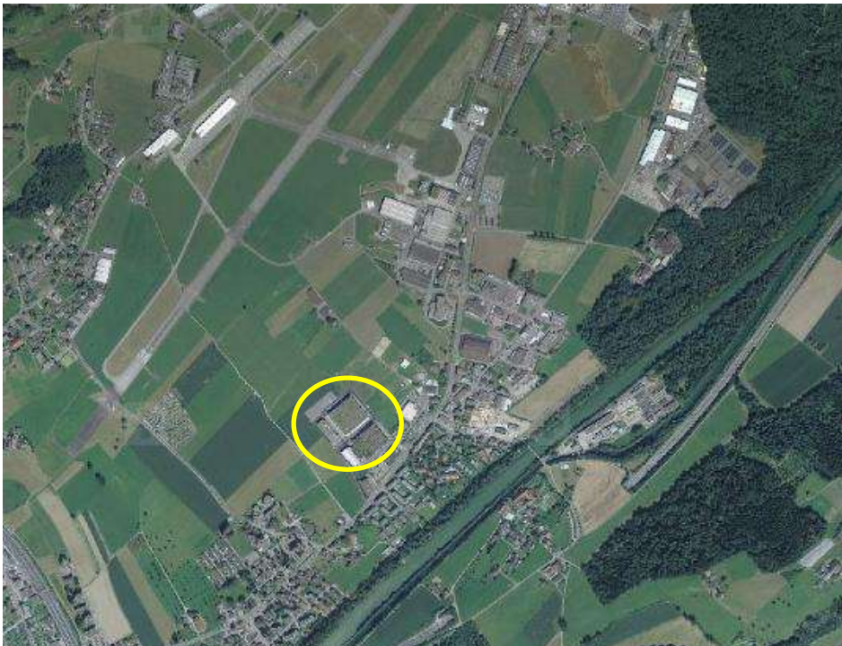
Abb. 4. Lage der Flachdächer in Emmen. Die Dachflächen sind von oben kaum von den landwirtschaftlich genutzten Flächen zu unterscheiden.

wachsenen Vögel regelmässig nach Nahrung, ebenso auf den Ackerflächen und den beweideten Grünflächen.