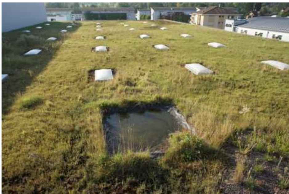
Abb. 6. Blick auf das Dach B mit dem künstlich angelegten Teich im Vordergrund und der durch Dach A beschatteten Fläche am linken Bildrand.