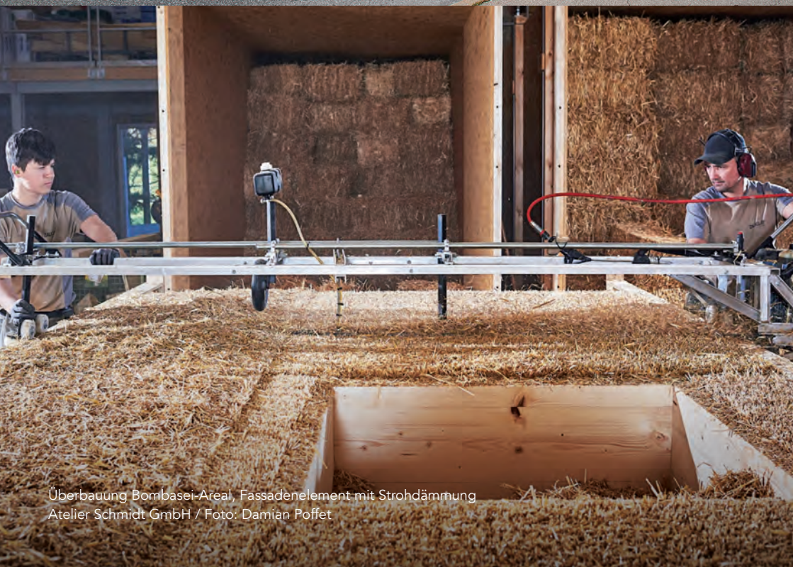
Überbauung Bombasel-Areal, Fassadenelement mit Strohdämmung Atelier Schmidt GmbH