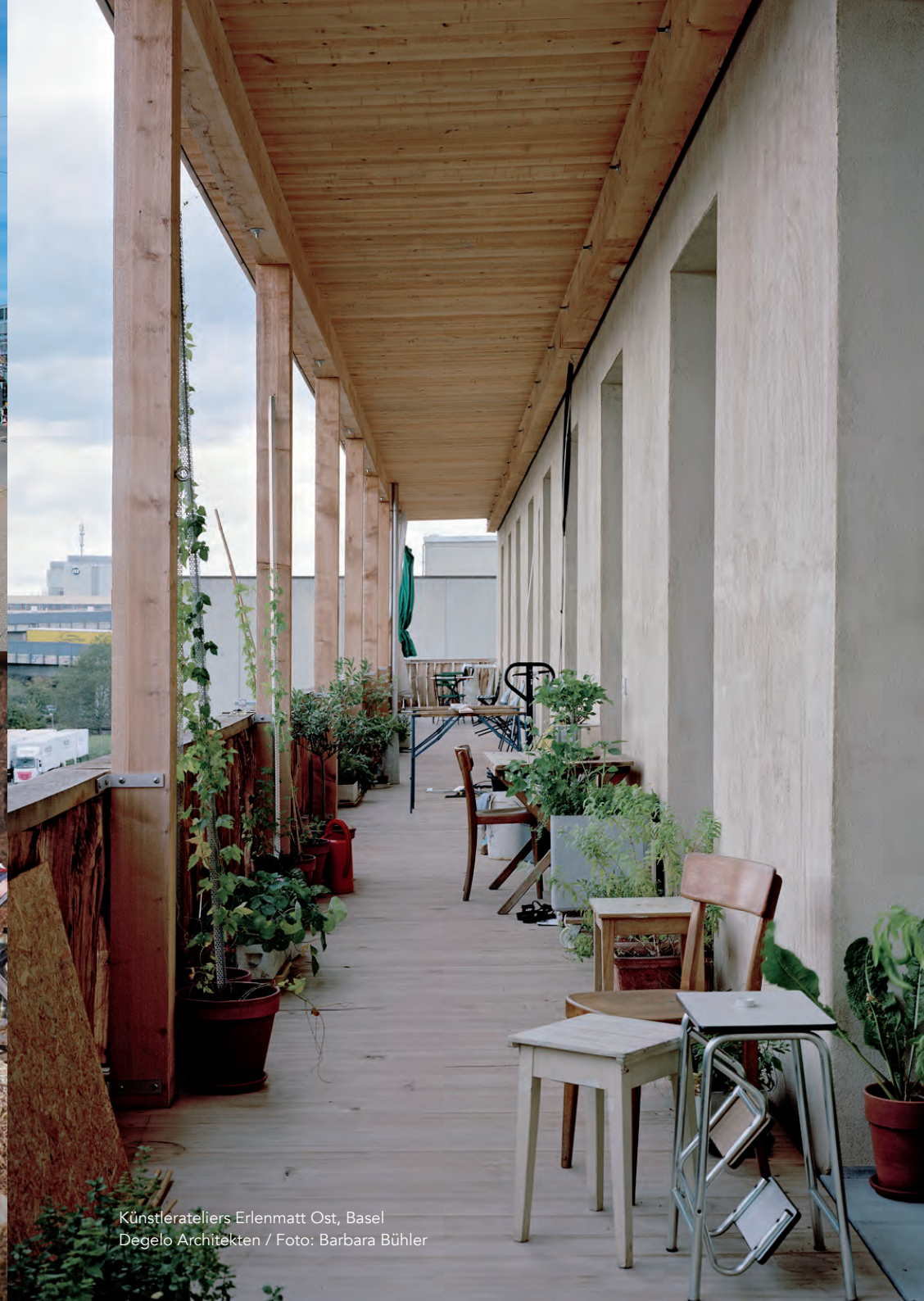
Künstlerateliers Erlenmatt Ost, Basel Degelo Architekten