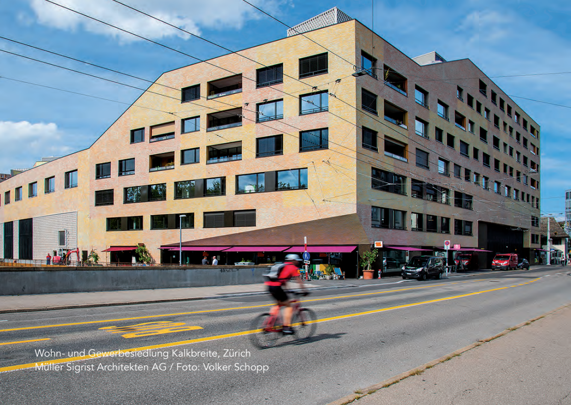
Wohn- und Gewerbestädung Kalkbreite, Zürich Müller Sigrüst Architekten AG / Foto: Volker Schopp