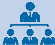
Perspektive auf bessere Karrierechancen