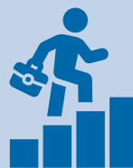
Verbesserte Chancen auf dem Arbeitsmarkt